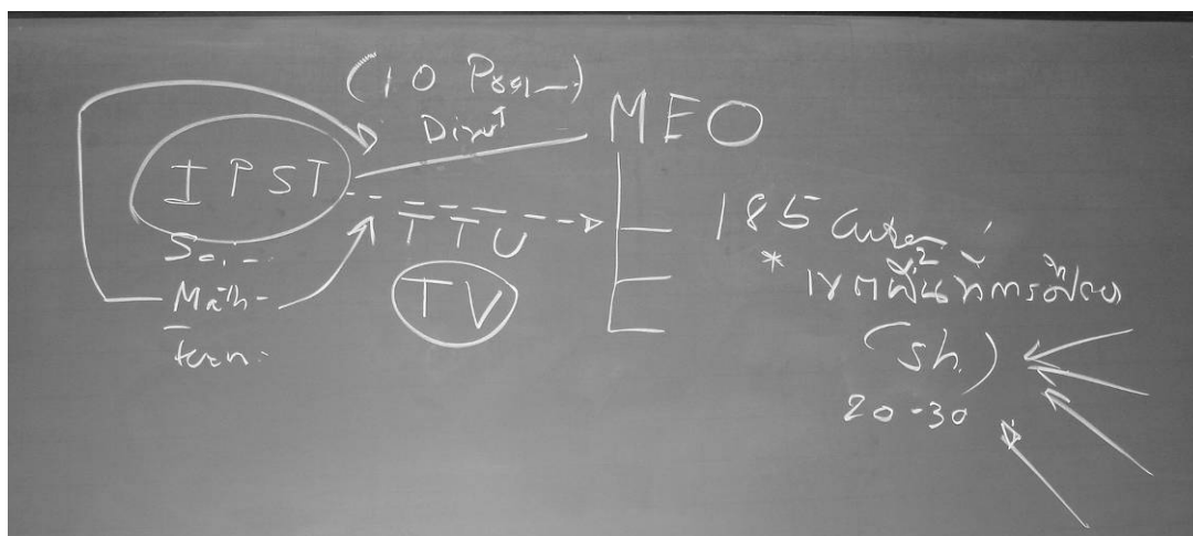
図2 科学技術教育振興研究所 IPST の遠隔教員研修に関する講義の板書

放送は、教育テレビ局 ETV からの単一方向で、全国 185 区（公称 175 区）の教育行政区教育局に設置された研修センターまたは設備の整った学校を会場にして実施されている。遠隔教員研修であっても、対面講義・演習形式の直接研修と、内容は相違が生じないように配慮されている。