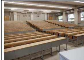
イス・机階段状固定タイプ

※ 施設使用料単価は光熱費(施設使用に伴う電気代、水道代、冷暖房費等の費用)を含みます。