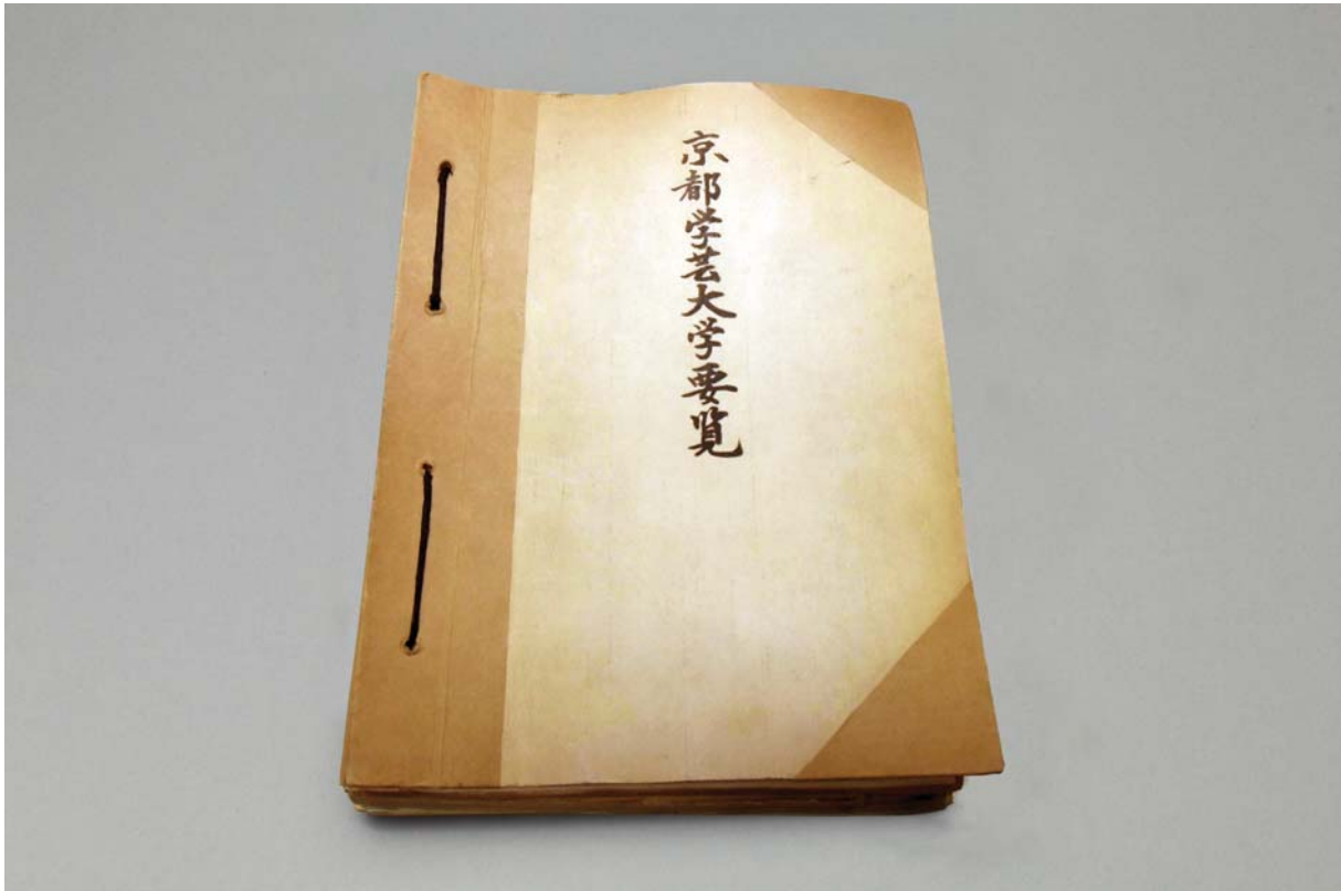
京都学芸大学要覧