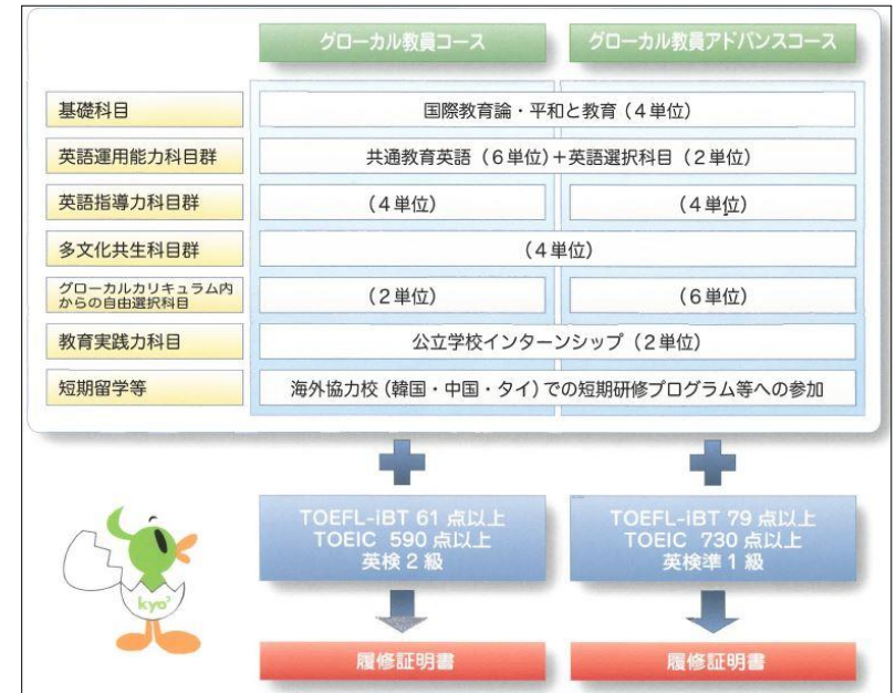
グローバル教員育成プログラムの概要