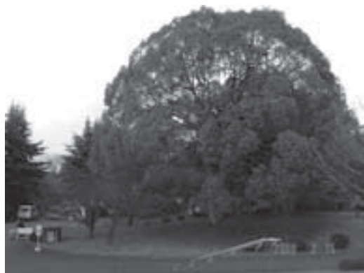
現在の講堂前の楠

また、正門を入れて右手の現在の講堂の場所には、1メートルくらいの高さのコンクリートの構造物があつて、その上に木造の建物があり、倉庫になっていて、その一角に教職員組合のボックスがありました。そのコンクリート構造物は半地下で地中に埋もれていて、それは軍隊時代の弾薬庫だと聞きました。私は、本学に就職してまもなく教職員組合の代議員をさせられ、その組合ボックスに、会議で行ったことを覚えています。講堂前の楠の大木は今は「この木何の木」の木か、「となりのトトロ」に出てくる木のように大き