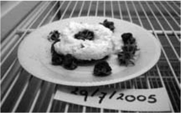
写真4 放置実験1ヶ月