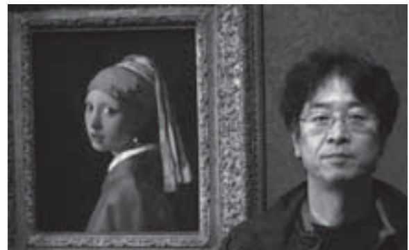
写真2 フェルメールの青いターバンの少女