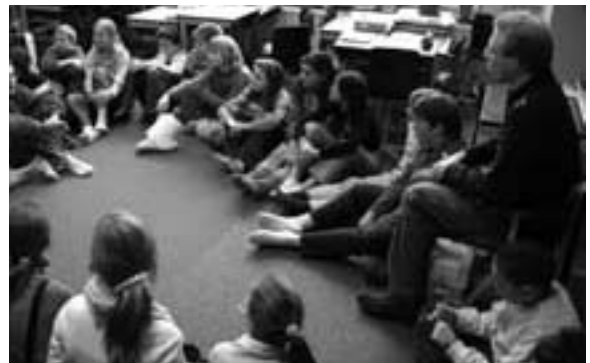
写真6 イエナプラン小学校授業風景