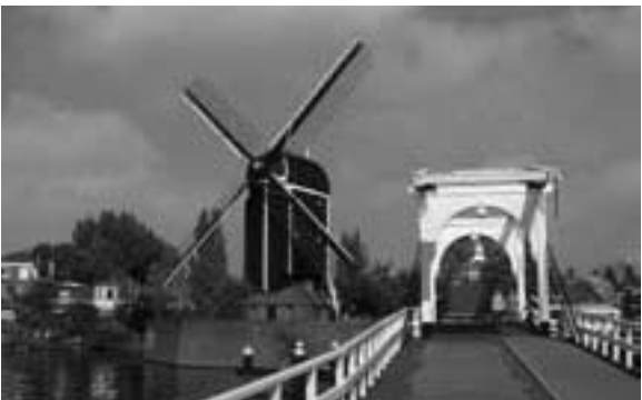
写真5 ライデン大学付近の風車

ライデン大学植物園(写真5)は、植生が豊かな公園といった趣であるが、16世紀以降の世界中の植物を採取し、栽培していた。設備は古く歴史を感じたが、手入れは行き届いており学術的にも貴重な存在である。園内にはシーボルトやリンネにまつる展示があり植物分類学の拠点として伝統を感じた。日本の固有種であるミカンも栽培されておりシーボルトが持ち帰ったとのことである。