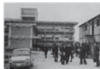
写真3 仮校舎から本校舎へ

昭和41年4月に現在の校地に移ります。もとは陸軍第一六師団の物資の補給などの任務にあたった輜重隊の敷地跡で、第二次世界大戦後アメリカ軍に接収されていたところです。この校地にまず完成したのは特別教室棟（北棟）で、この棟のみで10学級の授業をすること、研究校としての公開授業に耐えうる広さを確保することが条件でした。ただ、3階の建物では9教室しか確保できないため、本館への通路と生徒関係の部屋を利用して10教室を確保したとされています。【写真3】は現在の校地への引越作業中のものですが、手前に伸びている2階部分が1教室にあてられました。この時点では、現在のメディアセンターの建っているあたりにアメリカ軍が兵舎として使用していた建物が、さらに校地の東北の隅には事務局長官舎が残っていました。また、体育館はなく、グラウンドにあたる場所は瓦礫が散乱している状態で、施設全体を見ると全く不十分なままに学校が運営されていたことがわかります。