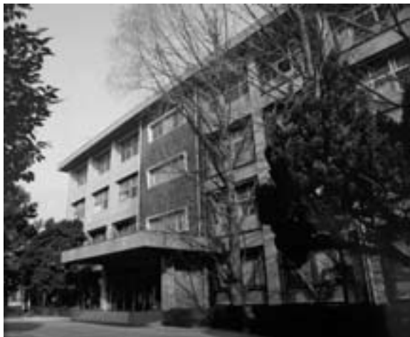
写真4 耐震工事完了後の校舎

校舎の耐震に関する強度測定では1年早く建設された特別教室棟は安全で、本館のほうが補強が必要とのことでした。現在進行中の大学構内の耐震補強工事では建物内への立ち入りは禁止されていますが、高校の耐震工事では授業のために本館5教室はいつも使わねばなりません。工事の騒音、週単位で使用教室が変更されるという生活が半年間続きましたが、【写真4】のように補強が完了しました。新営工事同様とはいきませんが、二足制移行とも相まって美しい校舎となりました。