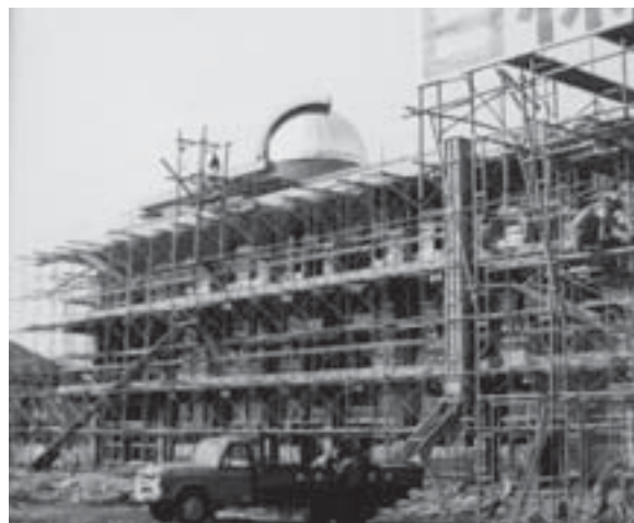
写真2 特別教室棟の工事