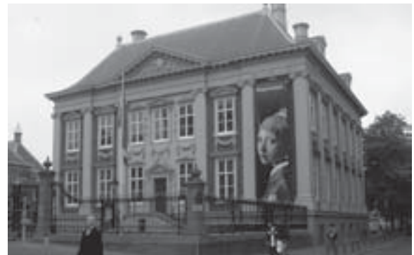
写真1 マウリッツハイス美術館全景

の眺望」がハーグセントラル駅からほど近いマウリッツハイス美術館（写真1）に展示してあった。数年前に神戸で見た名画に再会できるとは思わなかった。しかも、今度はツーショットである（写真2）。ハーグの町中では日本人を見ることはほとんどないが、この美術館での日本人の密度の高さには驚かされた。