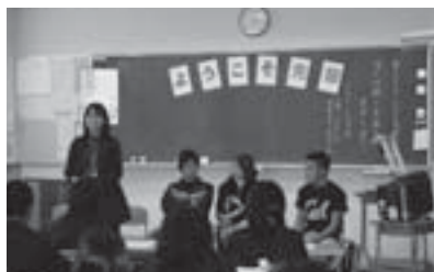
帰国生徒学級卒業生たちとの交流