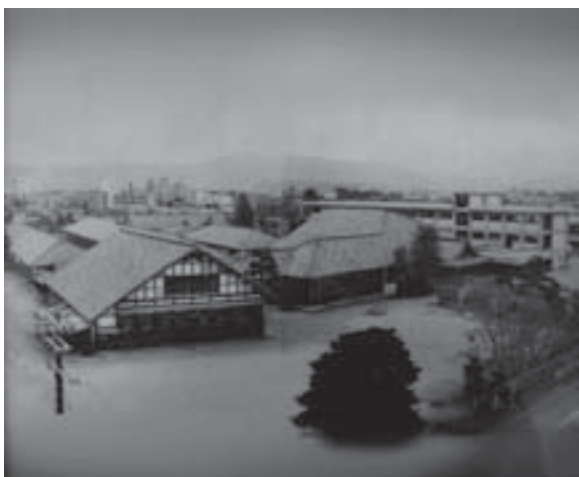
写真1 京都中学校にあった旧校舎

昭和40年4月に開校した高校は、附属京都中学校の現在の校舎が新築されたために不要となった旧校舎を利用して発足しました。旧校舎はもとの京都府師範学校の校舎の一部で、【写真1】でわかるように木造平屋建て、石炭ストーブが暖房具でした。その校舎は現在の京都中学校の体育館の東側の、京都府立鴨沂高等学校グラウンドとの間の塀に沿って建っていました。鉄筋の新しい校舎の中学校と古ぼけた高校の校舎という対照的な取り合わせの生活が1年間続きます。その間にも、『附高二十年史』（1985年3月刊）によれば、「玄関がもぎとられ、雨天体操場も一部切断」という状態で仮住まいの1年でした。写真の奥に見えている